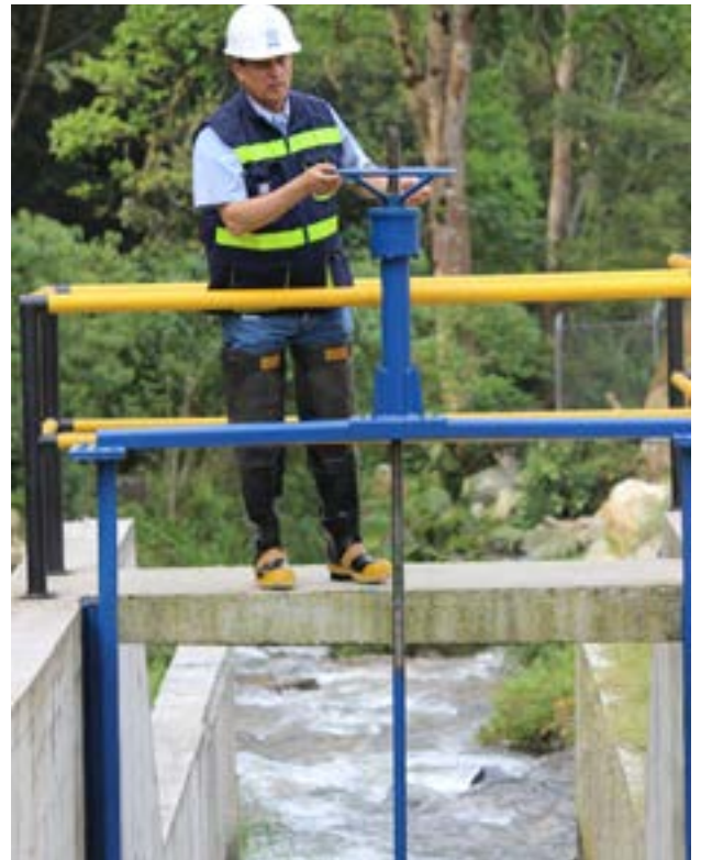
Válvula de cierre nuevo sistema Cay