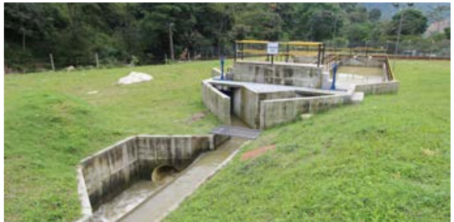
Canal de conducción abierto y desarenador incipiente, Bocatoma Cay

Es así como desde el IBAL, continuamos desarrollando grandes obras de calidad y duración, que le permitan a Ibagué ser una ciudad sostenible, amigable con el ambiente y responsable en las futuras generaciones, cumpliendo así lo estipulado en el Plan de Desarrollo propuesto para el municipio.